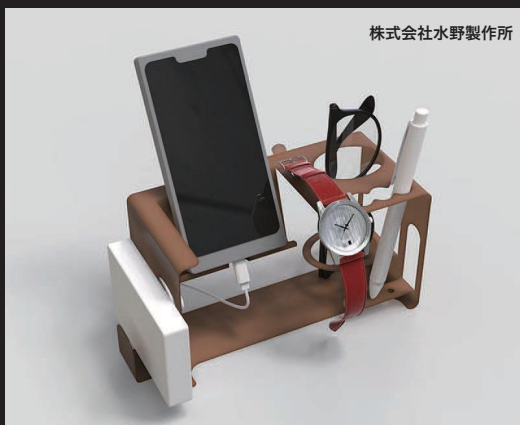
株式会社水野製作所