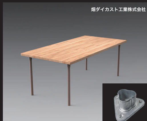
畑ダイカスト工業株式会社