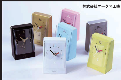
株式会社オークマ工塗