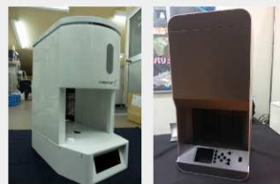
【一貫生産体制】 医療機器 筐体