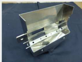
【難易度の高い製品】 医療機器ホッパー

面のビード出し、溶接をやめて接着剤、精度出しのためのフレーム板金化など“製品実現=美しさへの追求”へと繋がっています。